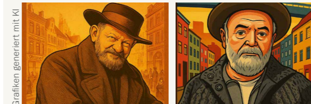
Grafiken generiert mit KI